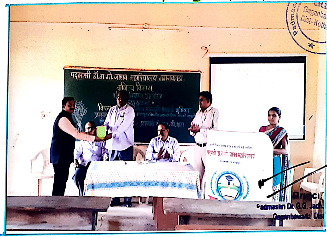
Principal Padmashri Dr. G.G. Jadhav Mahavidyalaya Gaganbawada, Dist- Kolhapur